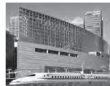
© TOKYO INTERNATIONAL FORUM CO., LTD.