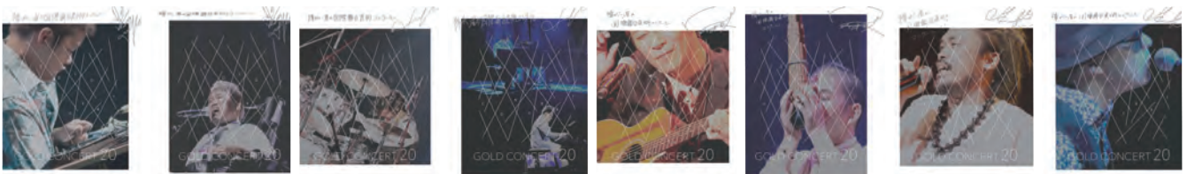
20周年記念ゴールドコンサートグランドチャンピオンシップ チラシ・ポスターイメージ