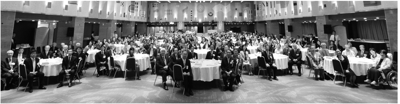
「一般社団法人日本筋ジストロフィー協会 創立 50 周年記念大会」全体写真（5月）

き」にそれほど差がないということ。②宇宙に行くとして筋力が弱るので、それを回避する生理学的研究は、筋ジストロフィーの分野と重なる部分が多いこと。③宇宙飛行士の低重力における歩行訓練は、筋ジストロフィー者のそれに応用できる可能性があること。